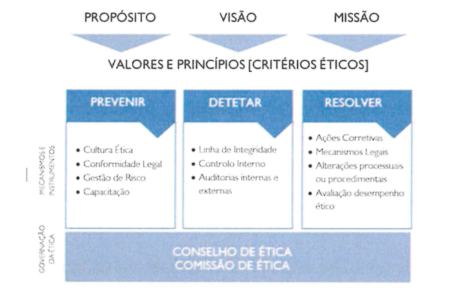
Figura 1 – Modelo de Integridade do Grupo AdP

O eixo “ Resolver ” integra as medidas a implementar, as metodologias de remediação para garantir a plenitude do modelo e a avaliação do desempenho ético do Grupo AdP através dos indicadores de desempenho ético.